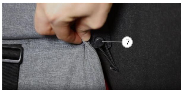
Abb. 5 / fig. 5