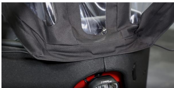
Abb. 3 / fig. 3