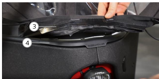
Abb. 2 / fig. 2