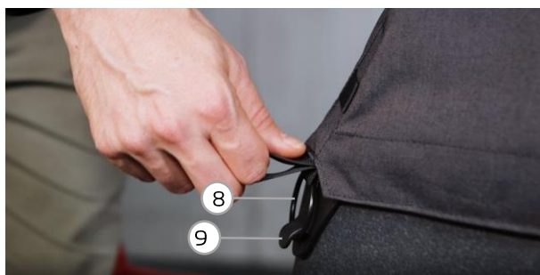
Abb. 6 / fig. 6