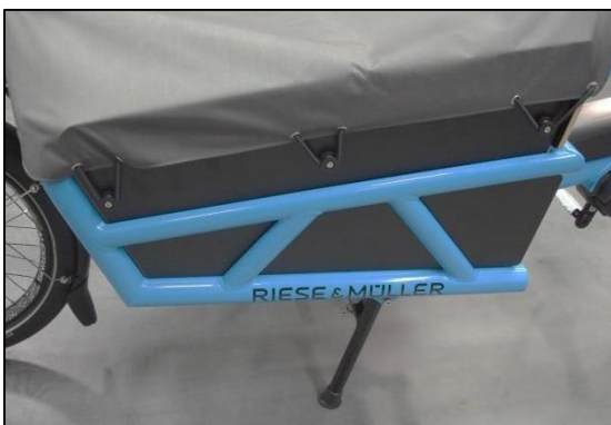
Abb. 3: Expanderseil verlegen