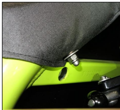
Fig. 2: mounted tarpaulin